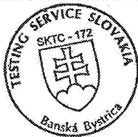
Ing. Jaromír Markovič

Platnosť certifikátu je obmedzená na obdobie od 25. 01. 2002 do 19. 05. 2010 v súlade s platnosťou certifikátu typu meradla č. 310078/127/210/00-014, ktorý bol vydaný SLM SKTC-127 dňa 06. 11. 2000.