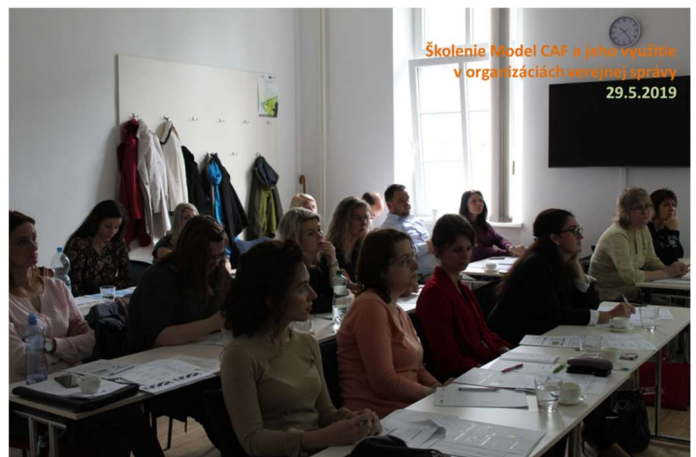
Školenie Model CAF a jeho využitie v organizáciách verejnej správy 29.5.2019