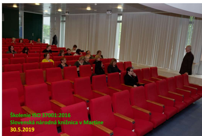
Školenie ISO 37001:2016 Slovenská národná knižnica v Martine 30.5.2019