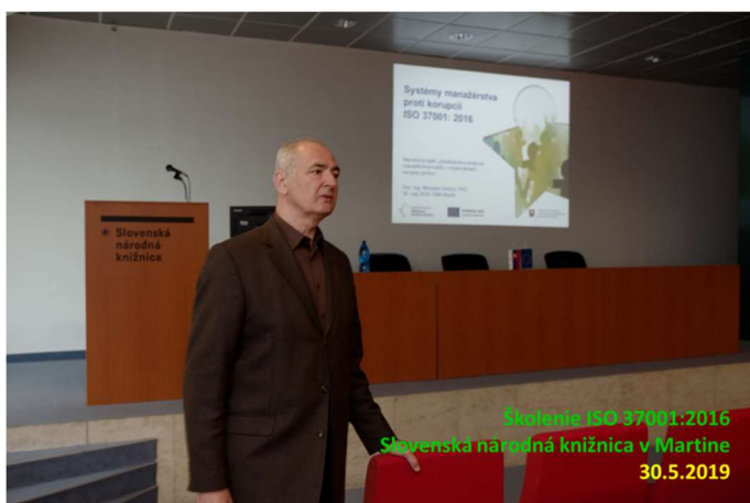
Školenie ISO 37001:2016 Slovenská národná knižnica v Martine 30.5.2019