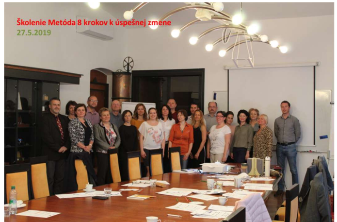
Školenie Metóda 8 krokov k úspešnej zmene 27.5.2019