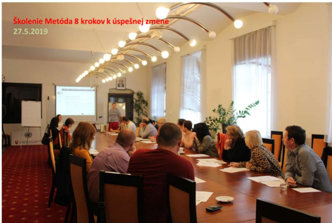
Školenie Metóda 8 krokov k úspešnej zmene 27.5.2019