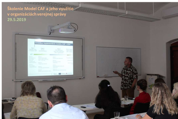
Školenie Model CAF a jeho využitie v organizáciách verejnej správy 29.5.2019

O školenie o modeli CAF a jeho využití v organizáciách verejnej správy je veľký záujem. Model CAF je nástroj komplexného manažérstva kvality šitý na mieru práve verejnej správy. Účastníci sa oboznámili s celkovou problematikou, kritériami a subkritériami, samohodnotiacou správou, akčným plánom a taktiež s modelom CAF v kontexte ostatných modelov manažérstva kvality. Školenia sa zúčastnili zástupcovia Ministerstva životného prostredia SR; Úradu podpredsedu vlády SR pre investície a informatizáciu; Mesta Hanušovce nad Topľou; Okresného súdu v Poprade; Okresného súdu v Žiline; Generálneho riaditeľstva Zboru väzenskej a justičnej stráže; Ústavu na výkon trestu odňatia slobody; Národného inšpektorátu práce; Slovenského metrologického inšpektorátu a Strednej odbornej školy Pruské. Účastníci školenia najviac ocenili celkové zorientovanie sa v problematike a pútavý výklad školiteľa.