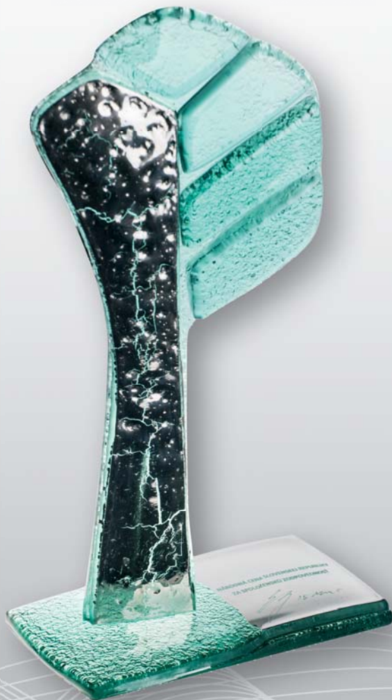
NÁRODNÁ CENA SLOVENSKEJ REPUBLIKY ZA SPOLOČENSKÚ ZODPOVEDNOSŤ