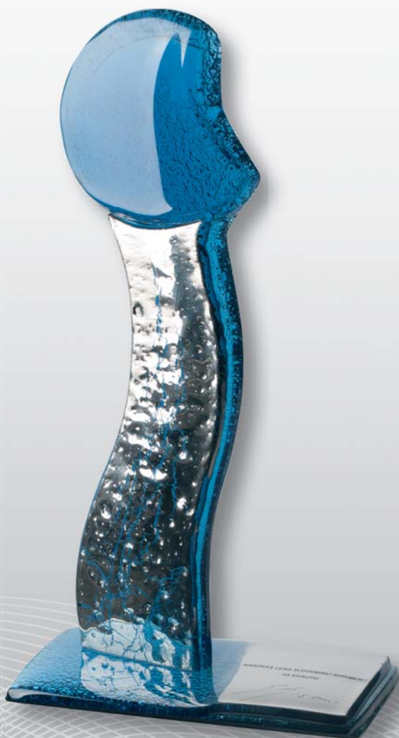
NÁRODNÁ CENA SLOVENSKEJ REPUBLIKY ZA KVALITU