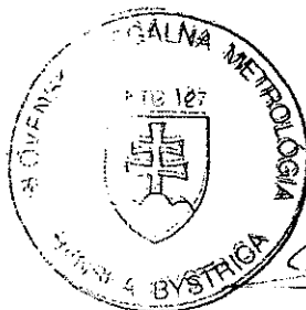
Jozef Slamka vedúci štátnej skúšobne SKTC - 127

P r í l o h a je neoddeliteľnou súčasťou tohto rozhodnutia. Obsahuje celkovo 3 strany, z toho 2 strany textu, a 1 stranu obrázkov.