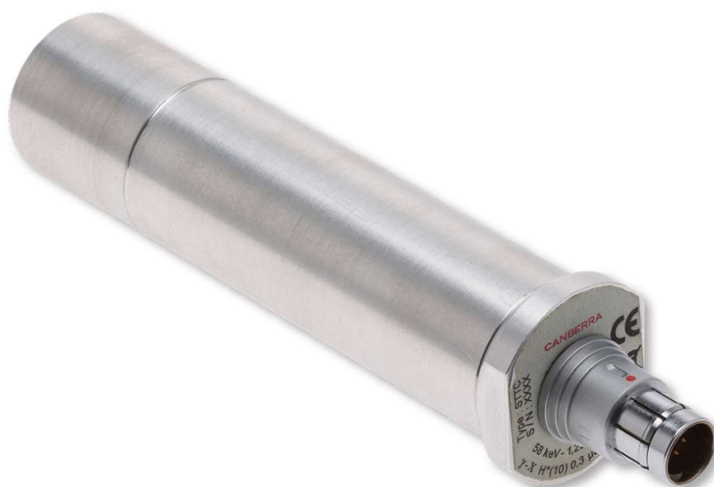
Obr. č. 2 Nákres sondy STTC